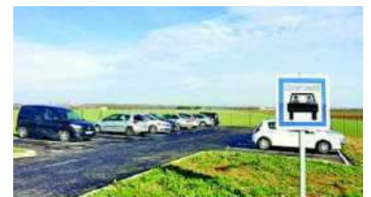
NOUVELLE AIRE DE COVOITURAGE À ANGOULINS PAR AMBRE DELAGE. Après dix jours d'ouverture, l'aire située au rond-point sur la D202, derrière le Buffalo Grill, semble avoir trouvé son public.