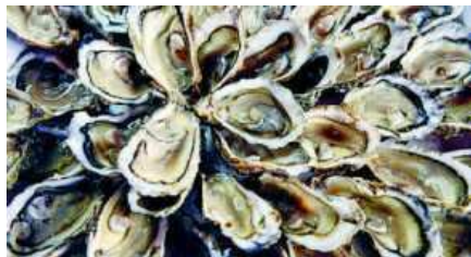
Des huîtres pour la Saint-Valentin.

L'HUÎTRE DE MARENNES-OLÉRON AUX COULEURS DE LA SAINT-VALENTIN À l'occasion de la fête des amoureux, le groupement qualité des huîtres Marennes Oléron va distribuer, début février, 50 000 couteaux roses et autant de sachets de gingembre aux ostréiculteurs du territoire pour qu'ils les insèrent dans les colis. Bonne Saint-Valentin !